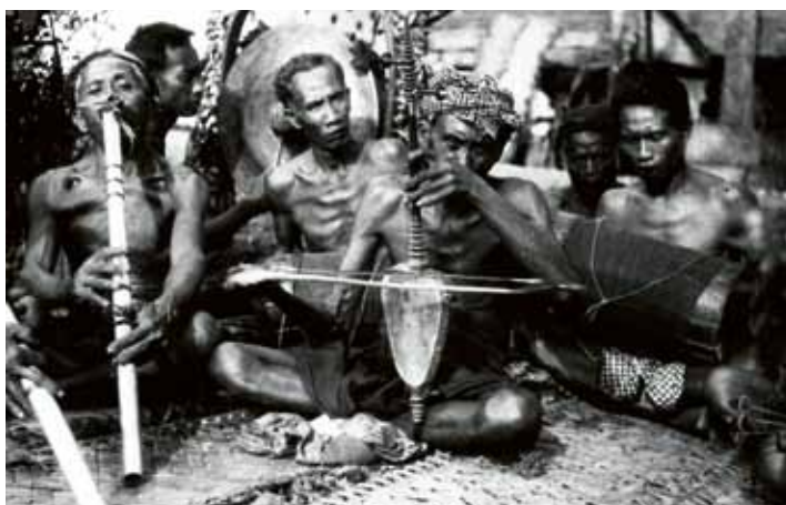
Colin McPhee förälskade sig i Bali och gamelanmusiken.

sik. Men Spike Jones satt så nära att han kunde både se och höra de knarrande skorna. Det gav honom idén att lägga in misstag i musiken och ersätta toner i välkända låtar med ljudeffekter. Typisk är hans vampyrversion av I only have eyes for you där kyssar låter som exploderande ballonger i en stor slottssal.